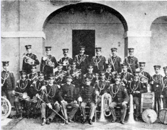
65 th Infantry Band in 1917

Music has always played an important role for the 65 th . Throughout the years, their popular band played in numerous events, including President William McKinley's inauguration in 1901. Music was also a source of comfort for many soldiers fighting at the front lines.