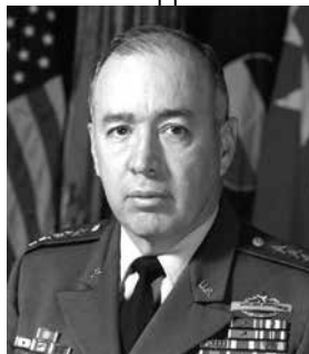
Gen. Richard Cavazos