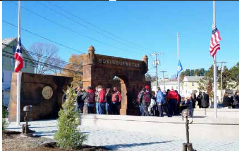
65th Infantry Regiment Memorial Park, New Britain, Connecticut