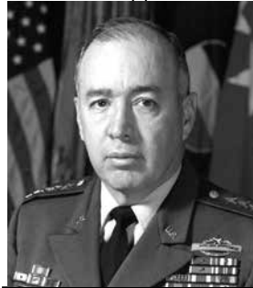
Gen. Richard Cavazos